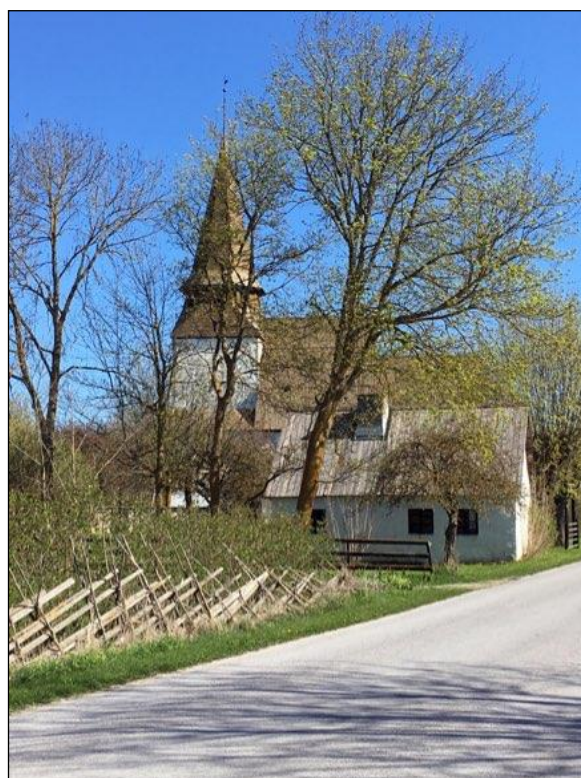
Gute gård, till vänster, är en av socknens största gårdar på 1600-talet. Byggnaden är från 1700-talet, påbyggd 1821. Till höger Bäls välbevarade sockenstuga och i bakgrunden Bäls kyrka