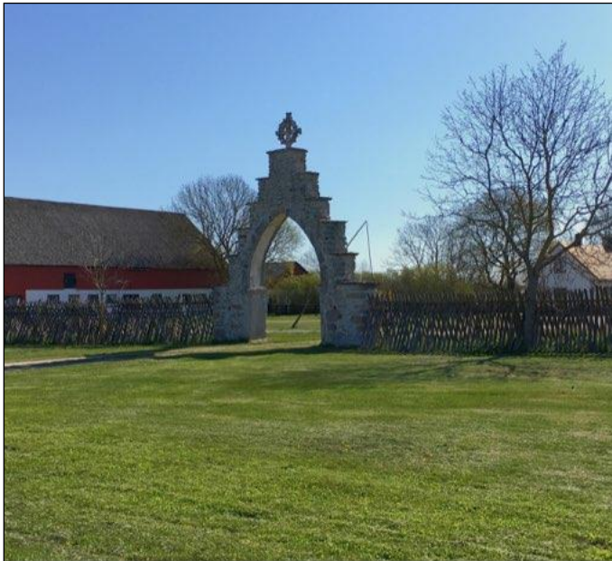
Den medeltida porten vid Riddare är ett bra belägg för att de gotländska gårdarna har legat på samma ställe sedan medeltiden och i många fall säkerligen också ner i vikingatid.

Vid Norrbys och Mallgårds finns spår av boplatser från stenålder och tidig bronsålder. öster om Riddare finns ett boplatsoområde från stenålder och norr om ligger bronsåldersrösen. Vid Kajsarve finns en labyrint. Järnåldern är synnerligen rikt företrädd. Främst längs med Hejnums östra väg, på kanten till Kallgateburg, finns flera separata delområden med välbevarade lämningar av ett mycket omfattande kulturlandskap med husgrunder, hägnadssystem, gravar och åkerytor. Här kan man tydligt se de förhistoriska gårdarnas läge i förhållande till dagens gårdar och följa kontinuiteten i utnyttjandet av marken. Den mest kända järnåldersgården är vid Rings, vilken grävdes ut i slutet av 1800-talet. En mängd fynd gjordes, mest av vardagliga redskap. Här finns ett flertal husgrunder, fägator, hägnader m m. Området är i dag betat och överblickbart. Vid Bjärs finns ett stort gravfält med tätt liggande gravar, som delvis undersökts och givit rika fynd. Det har använts under tiden Kr f - 1050 e Kr.