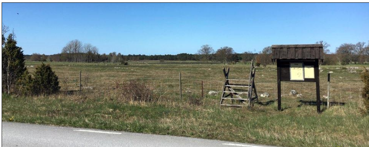
Järnåldersgårdarna vid Rings i Hejnum

Även Sudergårde består av två parter. Den norra har en stor manbyggnad på stenfot med flerdelad plan från ca 1870. En stor flygel är byggd i etapper på 1800-talet. Bland ekonomibyggnaderna märks ett tvåvånings magasin i sten från 1700-talet. Södra parten av Sudergårde hyser socknens mest välbevarade gårdsmiljö som även är skyddad som byggnadsminne. Mangårdsbyggnaden är en parstuga på stenfot från 1839 med karaktäristiskt brutet tak och pulpetfrontespis. Huset har tidstypisk apelsinfärgad spritputs med vita slätputsade omfattningar och gröna snickerier. En vacker snickarglädjeveranda har adderats under 1900-talets början. Den tätt stående brygghusflygeln är från 1700-talets slut, liksom en mindre före detta smedja intill. Ladugården är en god representant för byggnadstypen från 1900-talets början.