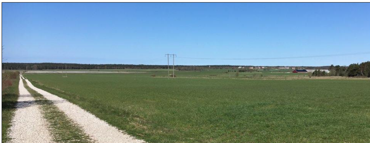
Hejnumdalen sedd från sydöst. Bilden illustrerar den öppna, idag helt uppodlade, dalgång som löper i nordsydlig riktning genom Hejnum socken. På andra sidan dalgången skymtar bebyggelsen på västra sidan av dalgången.

Hejnums centrala del består av en dalgång i nord-sydlig riktning, till vilken odlingsbygden är koncentrerad. Den begränsas i öster och väster av omfattande skogs- och hällmarksområden med mycket höga naturvärden och i norr av Tingståde träsk. Mindre lövmarker och ängesrester finns i odlingsbygdens östra och norra delar. Bäl sockens centrala del med nordligaste Vallstena, består av ett svagt kuperat jordbrukslandskap med lövdungar och ängsmark i öster och öppna åkrar i väster.